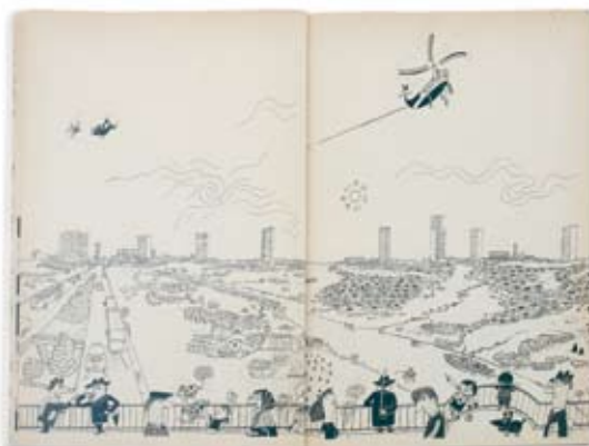
(Seiten 1+2) Faksimile eines Protokolls aus der Planungsphase der Interbau-Sonderschau „die Stadt von morgen“, unterzeichnet von Erich Kühn, der zusammen mit Karl Otto die Vorbereitungsgespräche zur Sonderschau leitete. Akademie der Künste, Berlin, Hans-Scharoun-Archiv, WV 200